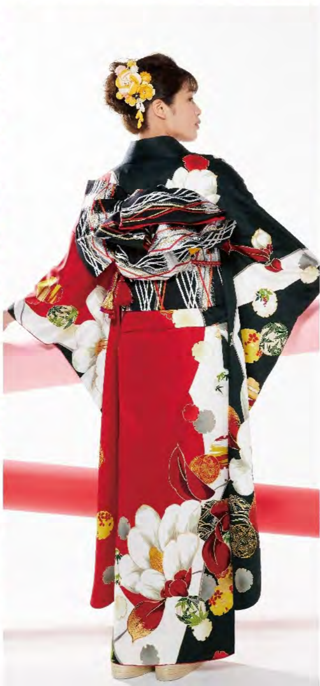
2115 お買上げコーディネート価格 税込 ¥418,000 オーダーレンタルコーディネート価格 税込 ¥209,000